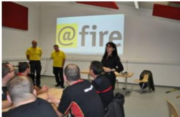
Conférence feux de forêts 27 novembre 2016

documentsfire-vortrag-kommunale-feuerwehren-ubersetzung-f-ok