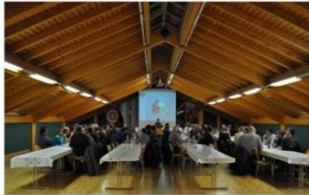
Assemblée Fédération de la Gruyère Riaz 2017