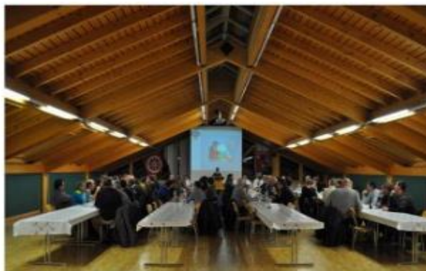
Assemblée Fédération de la Gruyère Riaz 2017