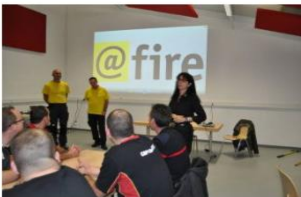
Conférence feux de forêts 27 novembre 2016

documentsfire-vortrag-kommunale-feuerwehren-ubersetzung-f-ok